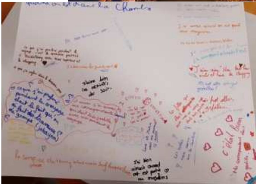
Commentaires des Français et des Allemands sur leur séjour...