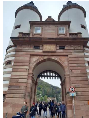
le vieux pont : « die alte Brücke »